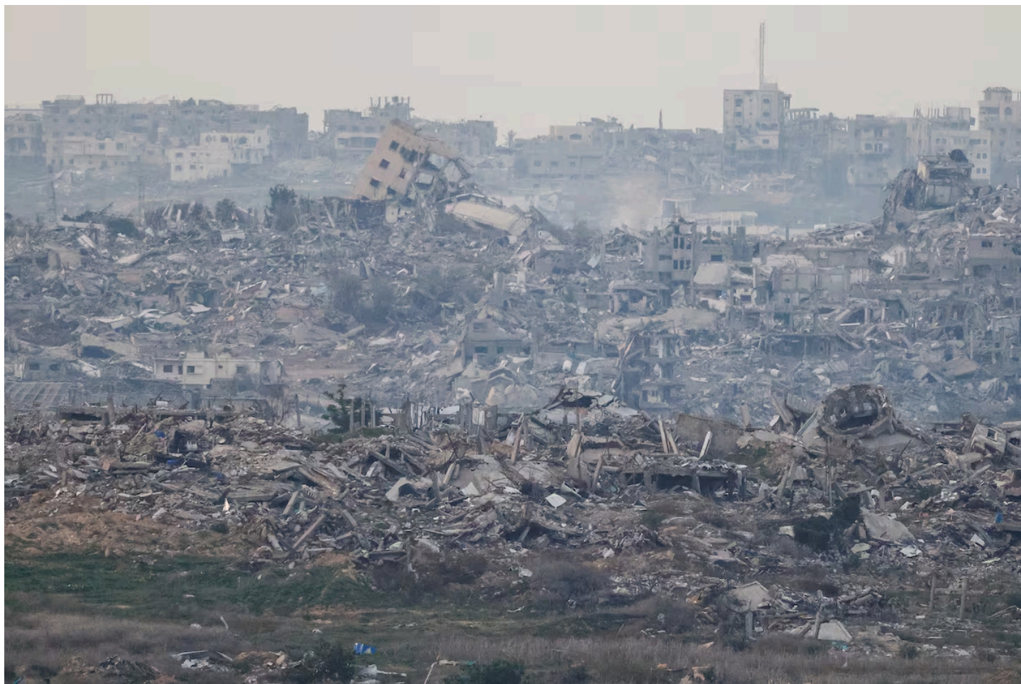
Edificios destruidos en el norte de Gaza, en una imagen de este martes.

hasta en la calle impulsan un acuerdo que Netanyahu había bloqueado en numerosas ocasiones