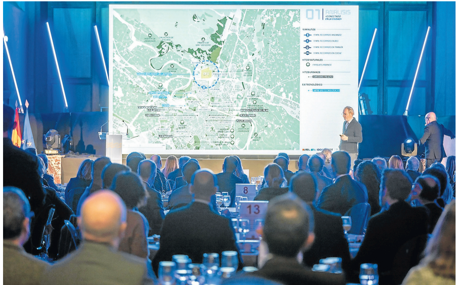
Un momento de la presentación, ayer en el edificio Pignatelli, del nuevo parque tecnológico de Aragón.

Azcón precisó que las nuevas obras del parque se iniciarán en septiembre de 2026, que la construcción de la sede emblemáti-