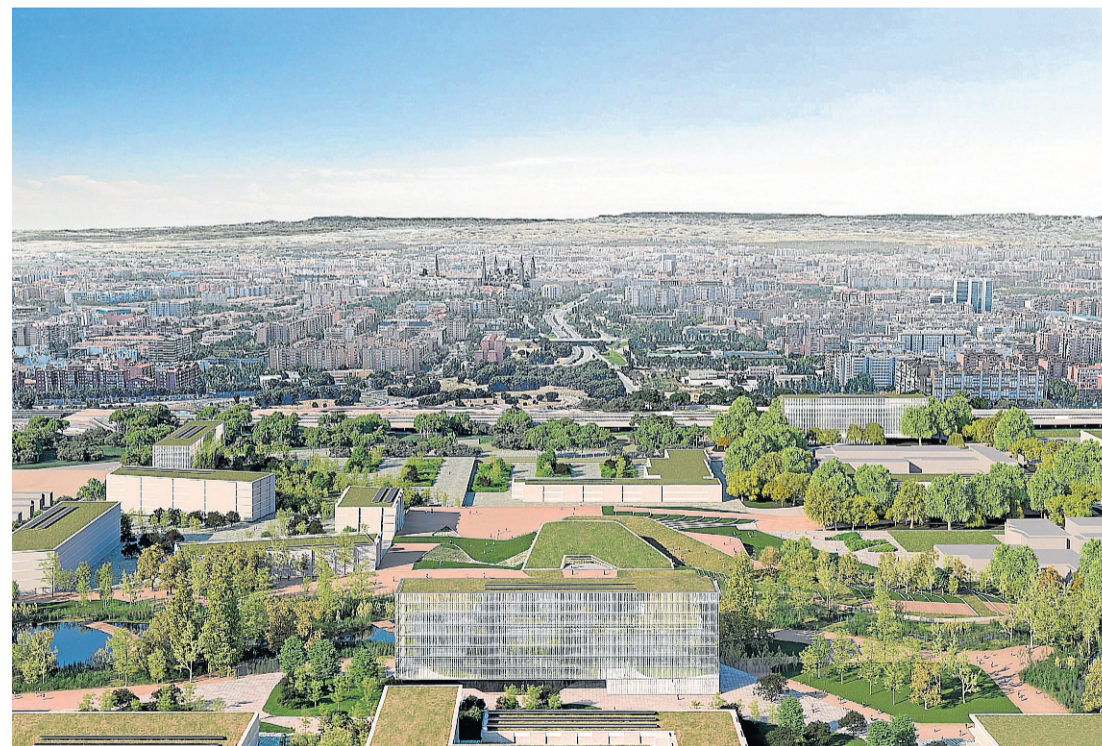
Recreación de parte del parque tecnológico, con su edificio emblemático en primer término. IDOM