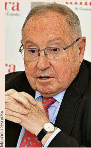
JOSÉ LUIS BONET Presidente Cámara de Comercio de España

“Supone un coste de 24.000 millones de euros; ningún autónomo va a contratar por el hecho de que un empleado trabaje media hora menos al día; el coste es inasumible”