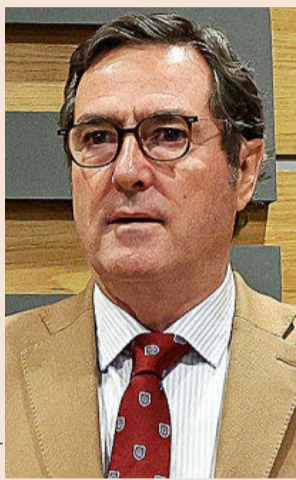
ANTONIO GARAMENDI Presidente de CEOE

No obstante, ya que la medida entrará al Congreso de los Diputados como proyecto de ley, desde las organizaciones empresariales señalan que existe aún una ventana abierta para modificar el texto y lograr ciertas modulaciones. Entre ellas, la incorporación de ayudas económicas suficientes para los negocios de menor tamaño, la posibilidad de ensanchar los plazos de adaptación de los convenios que de momento fija la ley antes del 31 de diciembre de 2025 o lograr ablandar el endurecimiento sobre el control horario y las sanciones asocia-