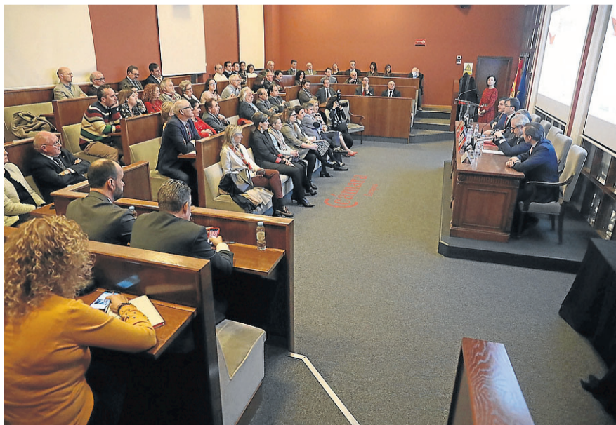
El Pleno de la Cámara está compuesto por 40 vocales y rige la corporación pública.

En 1868 y 1885 se celebraron las primeras exposiciones industriales en Zaragoza, reafirmando es-