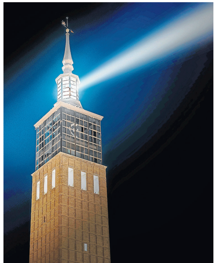
La Cámara es el faro que guía a las empresas en su camino hacia la competitividad.