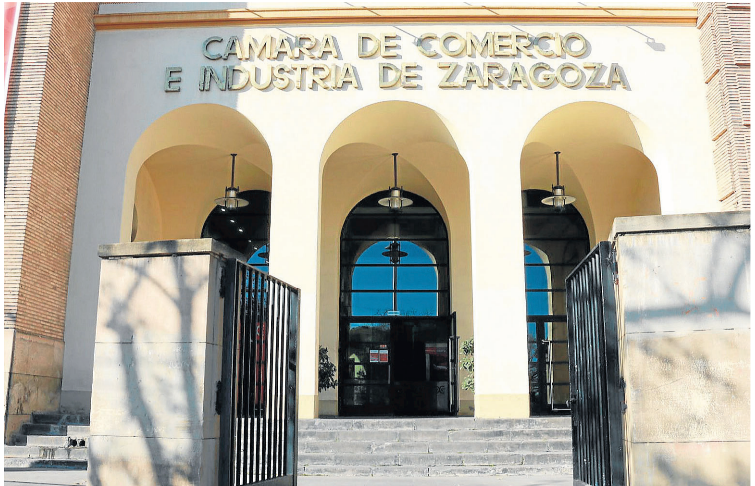
La Cámara de Zaragoza tiene siempre su puerta abierta para los empresarios.

El objetivo de la creación de la Cámara fue siempre trabajar por la modernización y el progreso de la estructura económica y se convirtió en una de las doce primeras creadas en España, la mayoría de ellas ubicadas en ciudades costeras o muy próximas a costas. Esta corporación constituyó el germen de las futuras fe-