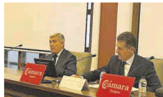
El presidente del alto tribunal aragonés, en la charla.