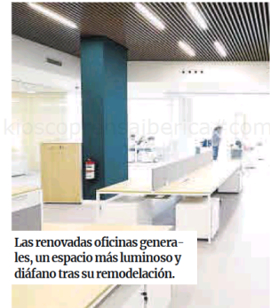
Las renovadas oficinas generales, un espacio más luminoso y diáfano tras su remodelación.