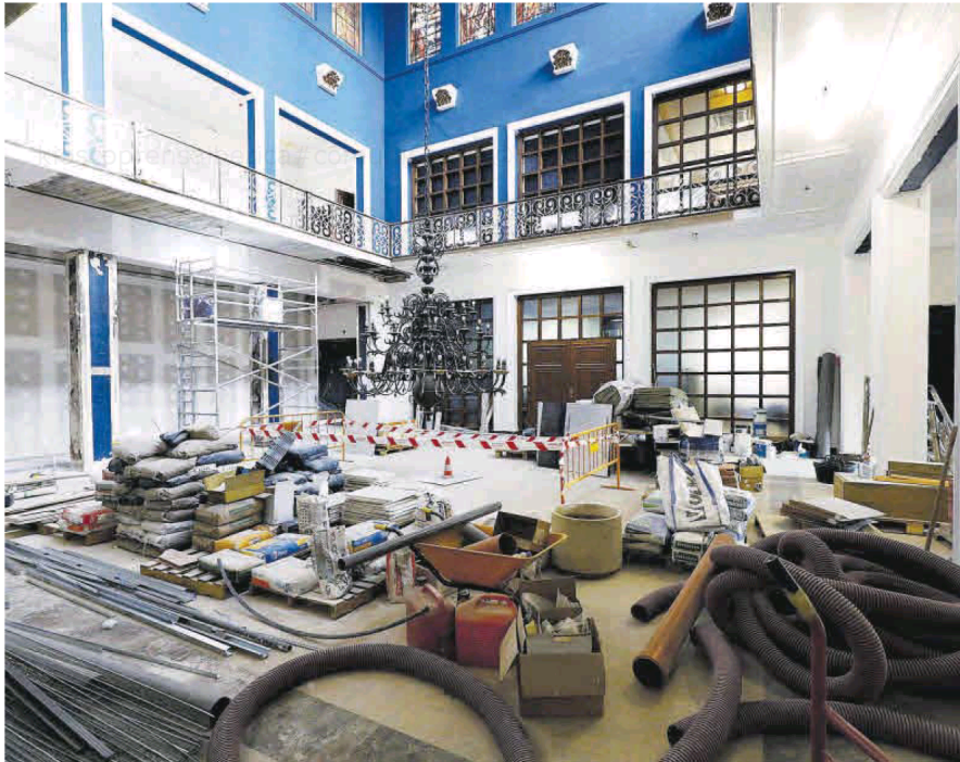
El vestíbulo de la Cámara de Zaragoza vuelve a lucir su característico azul intenso, al tiempo que prosigue las últimas obras de adecuación.