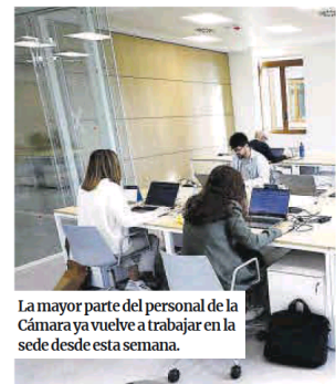
La mayor parte del personal de la Cámara ya vuelve a trabajar en la sede desde esta semana.