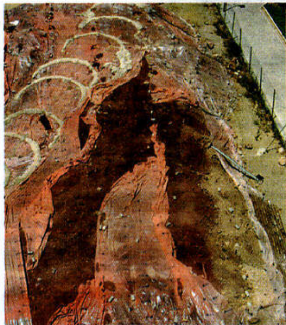
La ley establece los tipos de contaminantes.