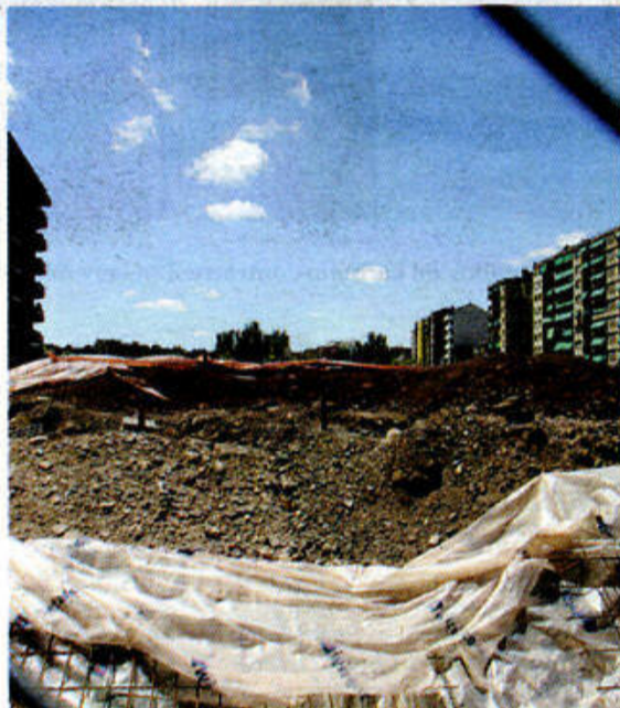
La norma impone multas para los incumplidores.