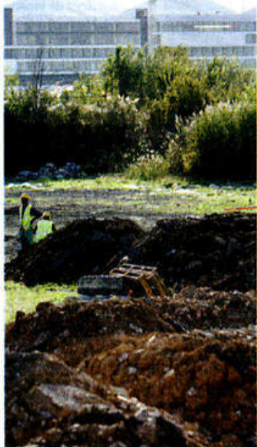
La tierra no puede trasladarse.