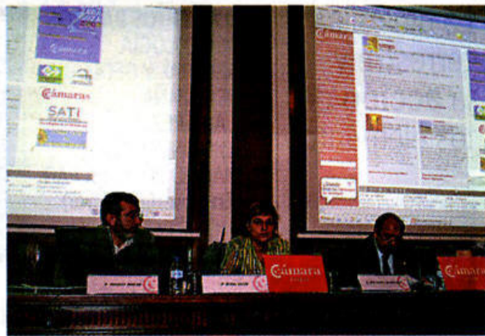
Jornada informativa de la Cámara de Comercio.

● ● ● LAS EMPRESAS que deben presentar el informe preliminar de situación para suelos contaminados tienen en Internet un aliado para encontrar información y resolver sus dudas. Este primer trámite administrativo lo pueden rellenar a través de la web http://calidadambiental.aragon.es/ del Gobierno de Aragón.