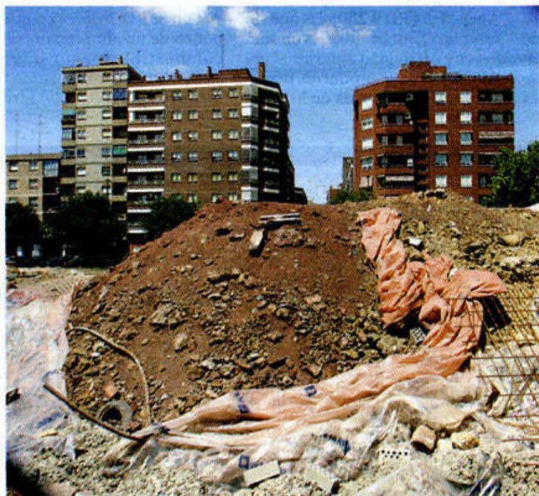
Los terrenos contaminados deben ser recuperados.