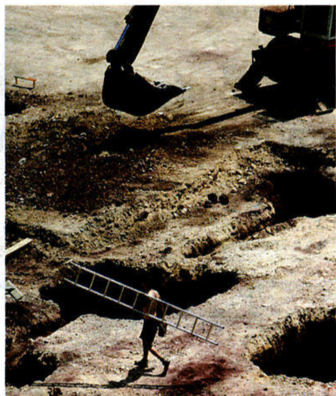
La situación del suelo se inscribirá en el Registro. CASAS

Deben declarar evidencias o indicios de contaminación de las aguas subterráneas.